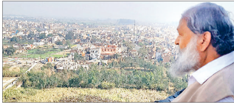
अंबाला। अंबाला छावनी के विकसित एरिया को देखते मंत्री अनिल विज।

नाए सेक्टरों में होगी ढांचगत सुविधाएं, ई-भूमि पोर्टल पर आवेदन शुरू