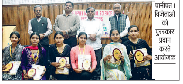
पानीपत। विजेताओं को पुरस्कार प्रदान करते आयोजक