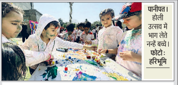
पानीपत। होली उत्सव में भाग लेते नरहं बच्चे।