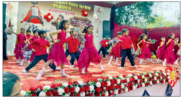
नीलोखेड़ी। कार्यक्रम में भाग लेते स्कूल के बच्चे।