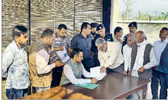
घरौंडा। लोगों की समस्याएं सुनते हरियाणा विधानसभा अध्यक्ष हरविन्द्र कल्याण तथा लोगों की समस्याओं का समाधान भी किया।

बजट सत्र में व्यस्त होने के बावजूद भी हरियाणा विधानसभा अध्यक्ष हरविन्द्र कल्याण अपने विधानसभा क्षेत्र में लोगों से मिलने पहुंचे और उनको होली पर्व की अग्रिम हार्दिक शुभकामनाएं दी। हरविन्द्र कल्याण अपने क्षेत्र के लोगों को वास्तव में अपना परिवार मानते हैं और उसी दृष्टि से व्यस्तता के बाद भी लोगों के सुख-दुख में हर समय खड़े रहते हैं। इसी कड़ी में शनिवार को कल्याण फार्म पर हरविन्द्र कल्याण ने लोगों की सामूहिक व निजी समस्याओं को सुना और उनकी समस्याओं का समाधान किया।