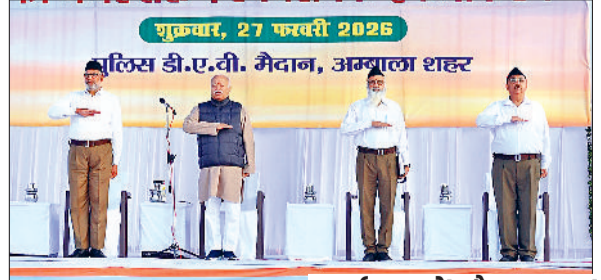
कार्यक्रम में मौजूद सरसंघचालक व स्वयंसेवक।

राष्ट्रीय स्वयंसेवक संघ के सरसंघचालक डॉ. मोहनराव भागवत ने कहा कि संघ ने सौ वर्षों की यात्रा में अपनी दशा बदली है। दिशा नहीं बदली, उसी के भरोसे हमें समाज का विश्वास प्राप्त हो रहा है। संघ को खड़ा करने में सौ साल लगे और अनुकूलता तो पिछले 20 वर्षों से लगातार बढ़ रही है। परंतु उससे पहले का पूरा समय उपेक्षा और विरोध में बीता। उन्होंने कहा कि बहुत कठिन परिस्थितियों में स्वयंसेवकों को कार्य को आगे बढ़ाना पड़ा। डॉ. भागवत अंबाला शहर के पुलिस लाइन ग्राउंड में