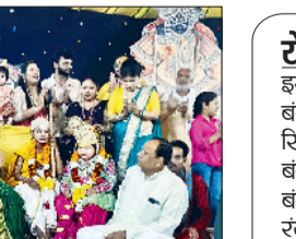
किशोरी का सम्मान किया। व उपस्थित जनसमूह को सात दिन की कथा सुनने मौका मिला व भी बधाई के पात्र है।