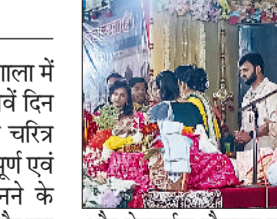
और प्रेमपूर्वक दौड़कर उन्हें गले लगा लिया। उन्होंने स्वयं सुदामा के चरण धोए, उनका आदर-सत्कार किया और उन्हें सिंहासन पर बिठाकर पूजा-अर्चना की। इस प्रसंग का वर्णन करते हुए कथा व्यास ने कहा कि भगवान भाव के भूखे होते हैं, धन-दौलत के नहीं। सच्चे प्रेम और निष्कपट भक्ति से ही भगवान को पाया जा सकता है। सुदामा द्वारा